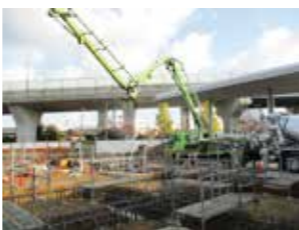
基礎コンクリート