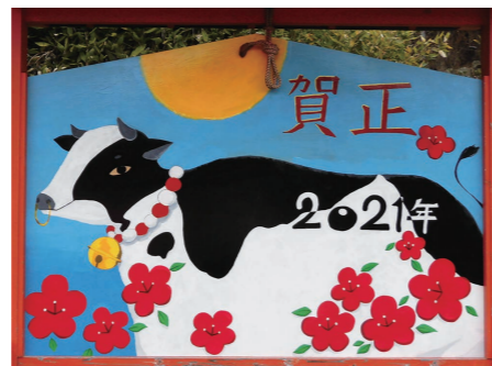
春日神社奉納絵馬