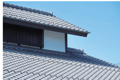
※屋根には絶対登らないで下さい。危険です。 ※一般財団法人 日本建築防災協会資料より抜粋

また、住宅の瓦屋根に強風対策を講じる際に活用できる補助制度が拡充される予定です。この機会に屋根や外壁等の改修はいかがでしょうか？ その他、リフォーム工事のご相談などお気軽にお問い合わせくださいませ。