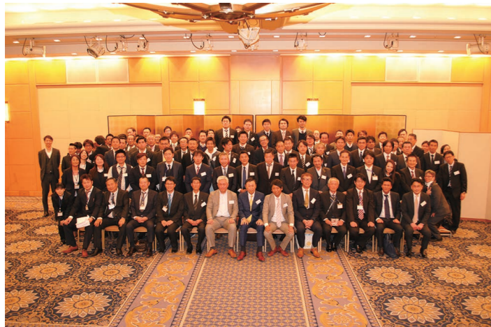
丸藤 GP 会