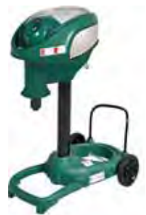
スーパー蚊取りくん

これからも人が育つ会社、楽しくやりがいのある仕事ができる会社になるように日々邁進してまいります。皆様これからも宜しくお願いします。