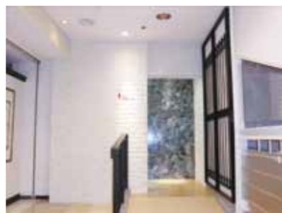
4F女子トイレファサード

訪れたお客様に「これ、本当にトイレ？」と聞いていただけるくらい感動していただけると幸いです。(笑)