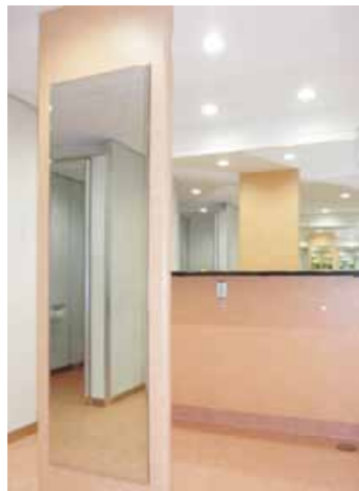
7F女子パウダーコーナー