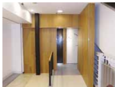
2Fトイレファサード