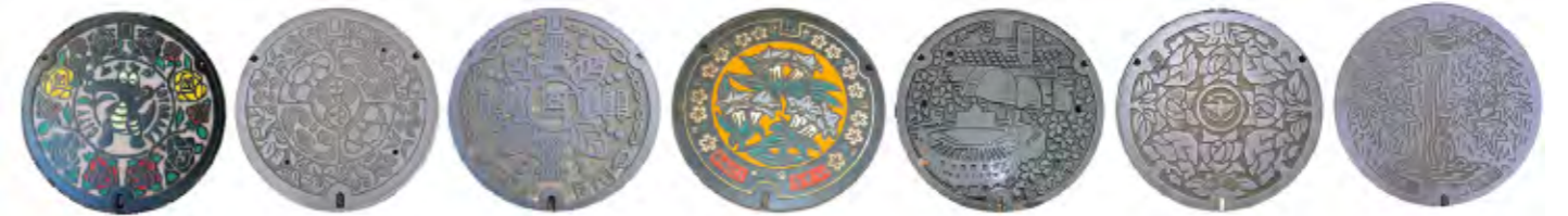
豊中市 マチカネワニ 吹田市 太陽の塔 岸和田 岸和田城 川西市 りんどう 西宮市 酒蔵 甲子園 茨木市 市章 パラ 箕面市 滝 もみじ

ある日、散歩中に道路のマンホールのデザインが市町村によって違うことを発見しました。よく見てみると市の特徴を表した図柄になっています。街の中心部ではカラーのものがあります。散歩、買い物、旅行など行かれた時など気を付けてマンホールを見つけてください。新しい発見があるかもしれません。見たことありますか？