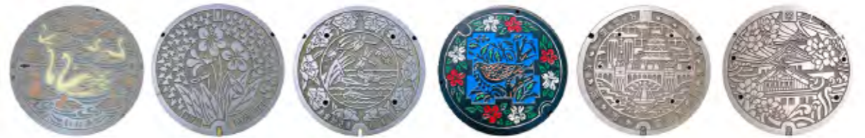
伊丹市 白鳥 宝塚市 すみれ 尼崎市 トンボメダカ 池田市 山鳩 サツキ 大阪市 中之島 大阪城 大阪市 大阪城